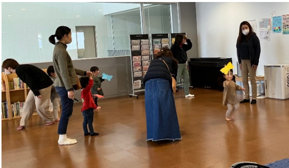
3月15日(水) Let's have fun with English! ☆ Stellar Education