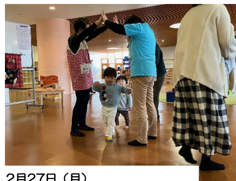
2月27日(月) 歌とリズム遊び ☆ 和い輪いくらび