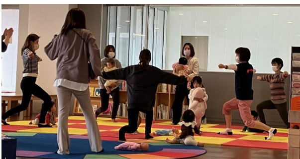
3月6日(月) 親子ピクス ☆ うすねニュースポーツクラブ