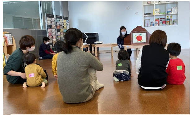
3月9日(木) 絵本・紙芝居で遊ぼう ☆ 沼田読み聞かせの会