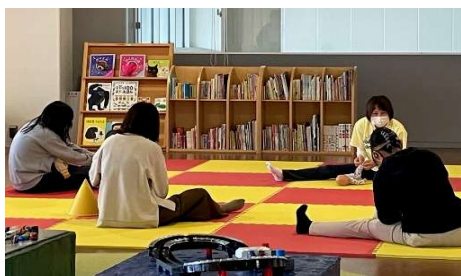
3月2日(月) 親子ピクス☆ うすねニューススポーツクラブ