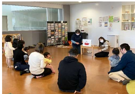
3月12日(木) 絵本・紙芝居で遊ぼう☆ 沼田読み聞かせの会