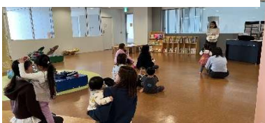
3月18日(水) 親子リトミック

子ども広場では主に月・水・金の午前中に子育てコンシェルジュが常駐しています。子育てコンシェルジュとは、保育施設のことなど子育てに関する情報をお知らせしたり相談にのったりする係です。月・水・金以外でも相談したいことがありましたら、スタッフまでお声かけ下さい。