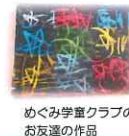
めぐみ学童クラブの友達作品

27日(木) スクラッチアート ※ 大人の間でも密かなブーム、スクラッチアートを体験してみませんか？