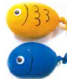
※ 先着10組まで 26日(木)締切

風船と紙粘土で手作りスクイーズを作ります。簡単だけど感触が楽しいおもちゃができますよ♪