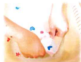
↑ 写真は一例です♡ 描いた絵が水面に浮かぶよ!!

通常の水遊びに加えて、今年は実験遊びやさんぎょすくい遊び・ビー玉探しなどを取り入れていきたいと思っています♡