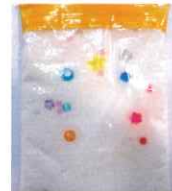
※ 先着10組まで 19日(木)締切

硬くて柔らかい!?不思議な感触「ダイラタンシー現象」を味わってみよう!! 片栗粉スライムで遊んだ後は、センサーバックを作ってお家でも楽しんでね☆